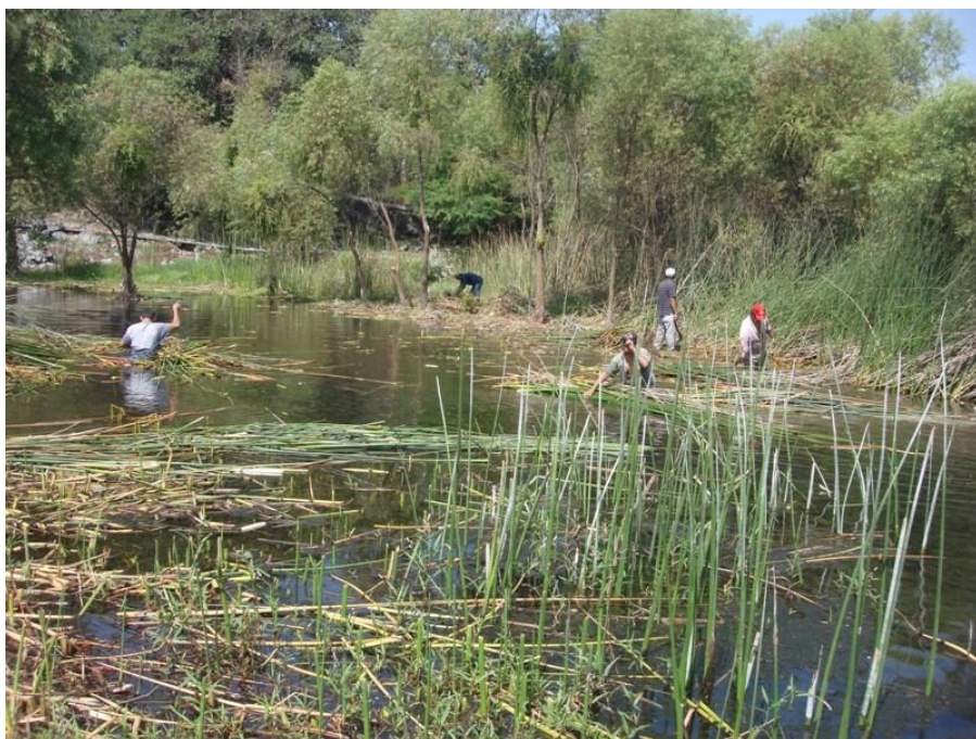
Limpieza por los habitantes del lugar de la Laguna de Hueyapan ubicada en el Parque Estatal

vecinos han buscado diferentes formas de resolver este problema. En uno de los puntos una parte de los vecinos decidió suspender momentáneamente la actividad.