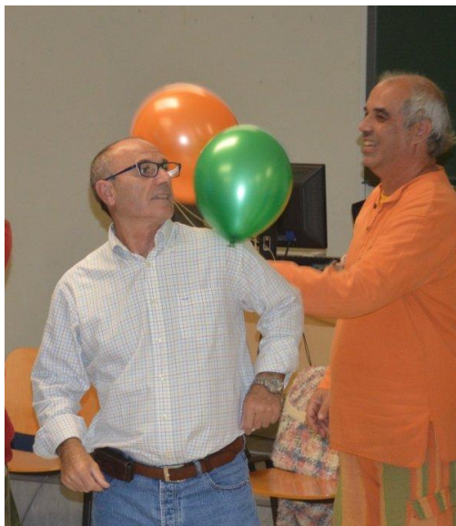
Actividad de las Jornadas en Sevilla (Andalucía)

Y una pregunta tonta pero se comparte ¿qué diferencias hay entre las formas participativas en los espacios y tiempos cotidianos españoles y mexicanos (Sevilla y Morelos)?