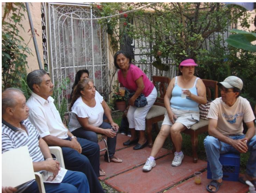
Reunión de vecinos planeando actividades

Aunque esta espiral participativa llevó a la realización de otras actividades autogestivas muy interesantes como lo fue la Siembra de hongos en el Texcal 54 , y el cultivo de Hortalizas y Eco-recorridos .