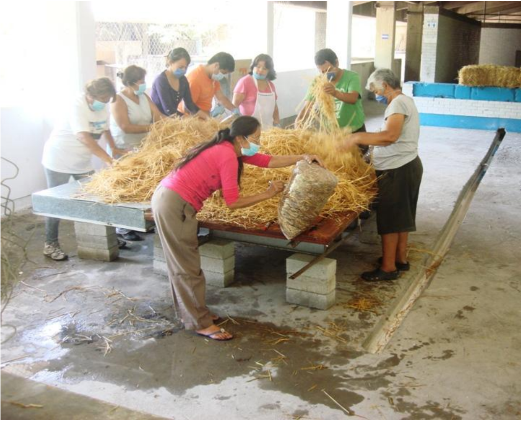
Siembra de hongos en el Balneario El Texcal