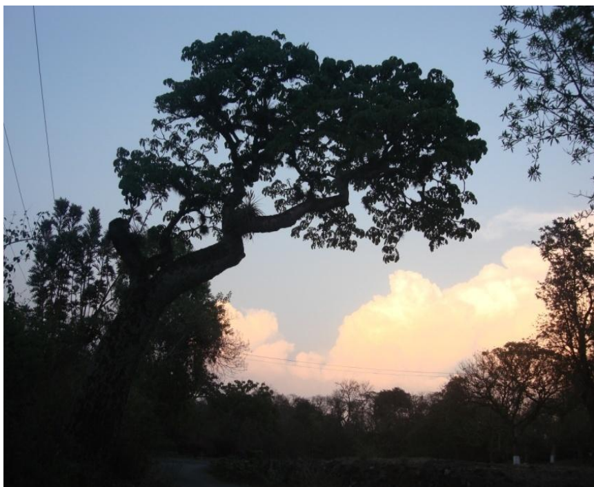
Atardecer en el Texcal