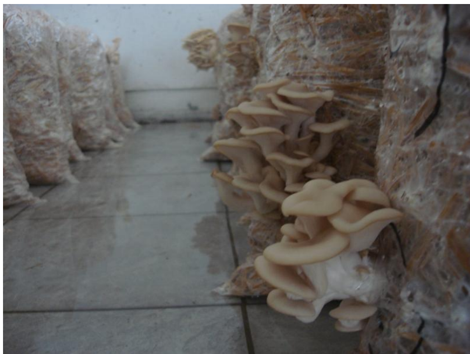
Hongos sembrados por comuneros y vecinos