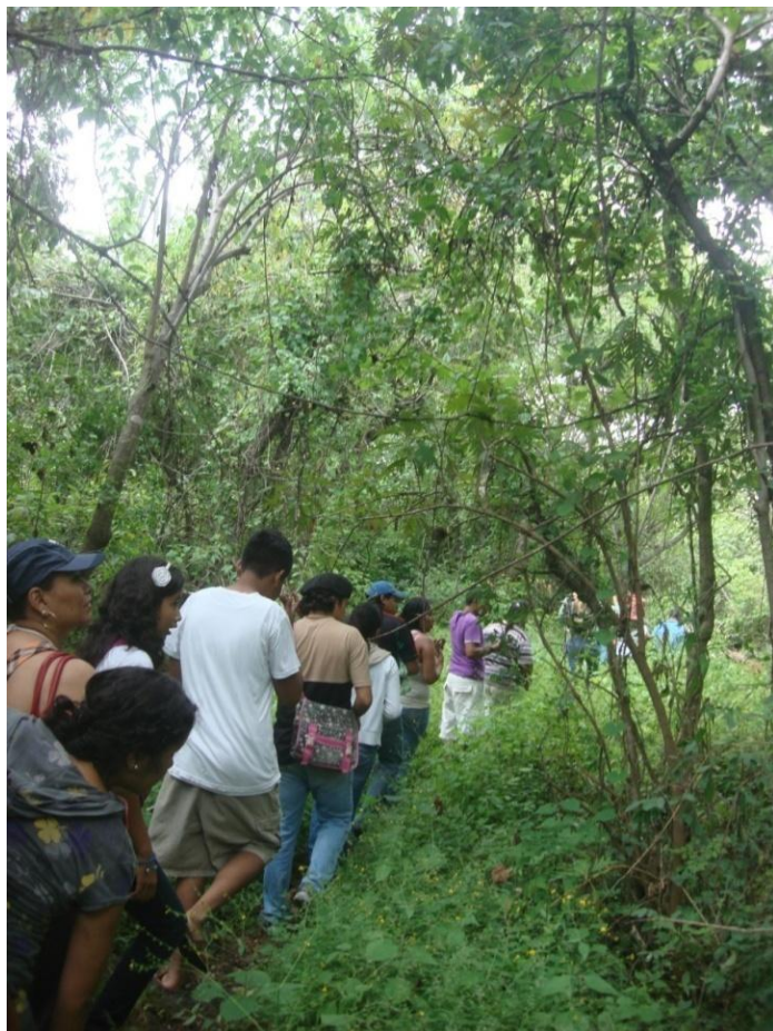
Eco-ecorrido en el Texcal

compartido con los vecinos y los comuneros y motivó la apertura de otras actividades.