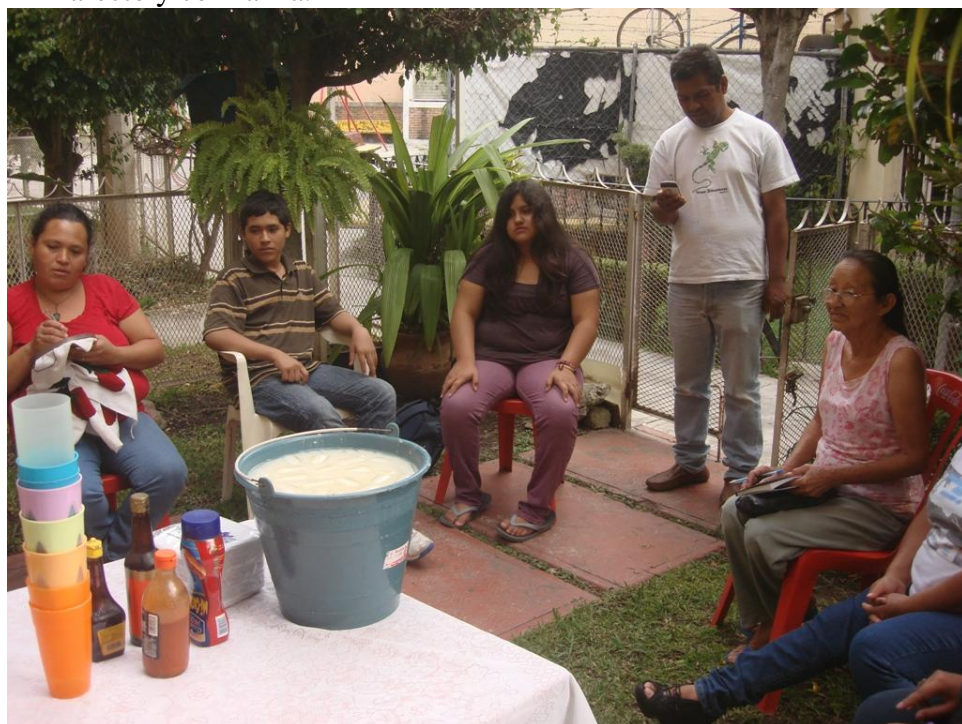
La universidad de los Hongos y la Convivencia

diferentes maneras y otros guisados para las jornadas de trabajo y encuentros nos han dado la posibilidad de animar relaciones de afecto y confianza.