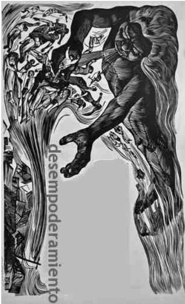
Basado en el grabado Temporal, portafolio Plenas, de Rafael Tufiño y Lorenzo Homar, 1954-55.